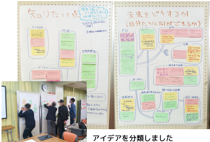
アイデアを分類しました