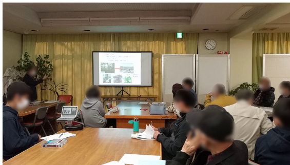
第1回・第2回のフォーラムをみんなでささうしました。

はじめに 地域フォーラム「独歩の森のナラ枯れを考える」シリーズ第1回では境4丁目にある独歩の森でのナラ枯れの状況を見て、第2回では講師の先生からナラ枯れの仕組みや日本での状況、多摩での状況、未来像などを学びました。第3回はそれらをふまえ第4回の意見交換会に向けて理解を深め考えをまとめました。