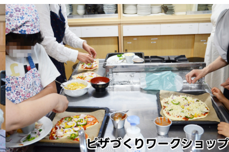
ピザづくりワークショップ