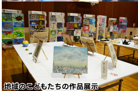
地域の子どもたちの作品展示