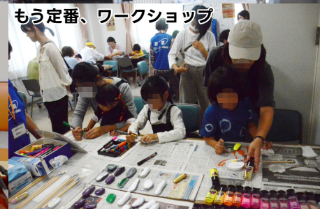
もう定番、ワークショップ