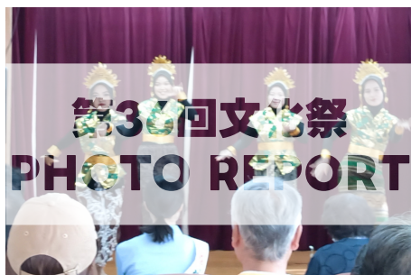
生歌で踊る佐渡おけさ